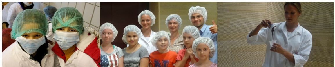
Pogledaj! Učenici osnovnih škola u posjetu Gavriloviću i Krašu

Auto Hrvatska, BILLA, Botanički zavod, Erste&Steiermärkische Bank, GLORIA, Hrvatska kontrola zračne plovidbe, Klinika za pedijatriju – KDB, Končar, Kraš, Odvjetnički ured Wahl Cesarec, Siemens Hrvatska, Vrtlarija Pecina, Zavod za dječju kirurgiju – KBC Rebro. Izabrano je 25 učenika kojima je dana prilika da u tvrtki ili instituciji po vlastitom izboru provedu dva dana te tako steknu iskustvo stvarnog rada u određenoj profesiji.